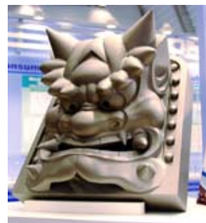
材料開発と加工技術の追求により誕生したチタン鬼飾り

加工性の追求とあいまって、陽極酸化法やイオンプレーティング法による豊かな発色、アルミナブラスト等の表面処理技術による味わい豊かな質感等、チタンでしか表現できない格調の高い意匠性を実現しています。